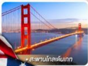
• สะพานโกลเดนเกต

★ เยือนอุทยานแกรนด์แคนยอน ผัง South rim ความมหัศจรรย์ทางธรรมชาติ ที่ยิ่งใหญ่ที่สุดแห่งหนึ่งของโลก