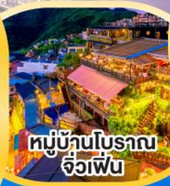
หมู่บ้านโบราณ จิวเฟิน