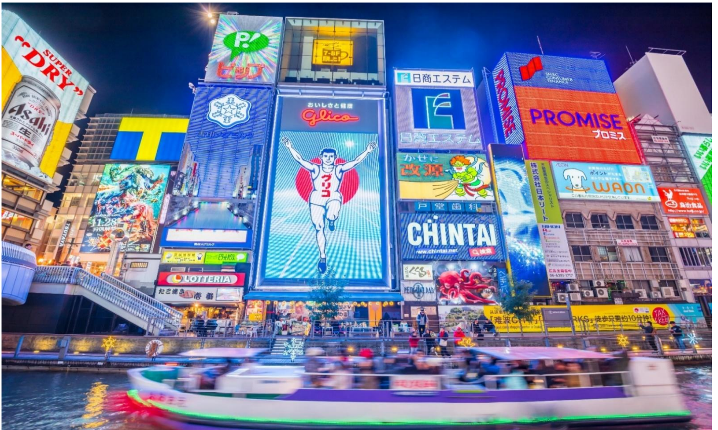
คำ อีระอาหารตามอัยาศัยเพื่อสะดวกแก่การช้อปั้ง ที่พัค SUN WHITE HOTEL, OSAKA หรือเทียบเท่า