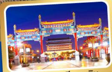
ถนนโบราณเวียนเหมิน