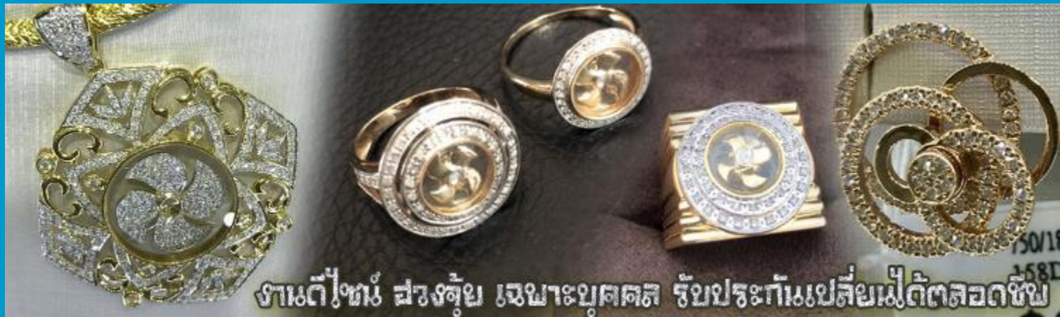
งานดีไซน์ สวยหรู เฉพาะบุคคล รับประกันเปลี่ยนไม่ได้ตลอดชีพ

นำท่านเยี่ยมชม โรงงานจิวเวลอรี่ ที่ขึ้นชื่อของฮ่องกงพบกับงานดีไซน์ที่ได้รับรางวัลอันดับยอดเยี่ยม และใช้ในการเสริมดวง เรื่อง ฮวงจุ้ยนำความโชคดี มั่งคั่งแก่ผู้สวมใส่ ซึ่งในเมืองไทยก็ได้นิยมแพร่หลายออกไป ไม่ว่าจะเป็นกลุ่ม ดารา นักการเมือง พ่อค้าแม่ขายที่ประกอบธุรกิจ เจ้าของกิจการห้างร้านต่าง ๆ ซึ่งเชื่อกันว่าจะนำสิ่งดี ๆ ปัดเป่าสิ่งชั่วร้ายให้กับบุคคลที่สวมใส่ ซึ่ง จะมีมากมายหลายชนิด เช่นจี้กั๊กหัน แหวนรุ่นต่าง ๆ นาฬิกาข้อมือ (ซึ่งผู้สวมใส่จะได้รับการดูลายมือจากซินเซปประจำร้าน เพื่อ แนะนำวิธีการเสริมดวงในการสวมใส่โดยไม่ได้คิดค่าบริการ)