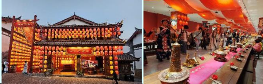
หลังรับประทานอาหาร นำท่านเดินทางเข้าสู่ที่พัก

ค่ำ บริการอาหารค่ำ พิเศษ เมนูชาบูโต๊ะยาว พร้อมชมการแสดงเต้นรำพื้นเมือง