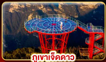
ภูเขาจิดดาว

หมู่บ้านโบราณริมน้ำตก "ฟุรงเจิน" สัมผัสเสน่ห์จางเจียเจีย มหัศจรรย์ทางธรรมชาติ