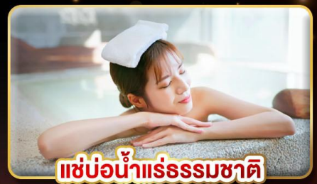
แช่น้ำแร่ธรรมชาติ