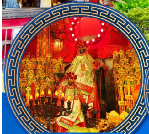
วัดเจ้าแม่กวนอิมสองอ่า