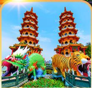
เจดีย์เสียมังกร