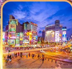
ย่านซีเหมินติง