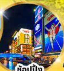
ช้อปปิ้ง ชินโซบาชิ

อิสระท่องเที่ยว 1 วันเต็ม วันอิสระเลือกชื่อ "Universal studio"