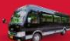
BUS (10-18 ที่นั่ง)