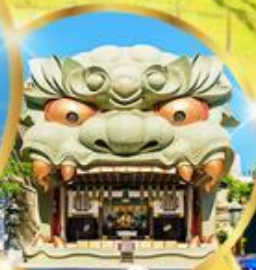
ศาลเจ้า นัมบะ ยาชากะ