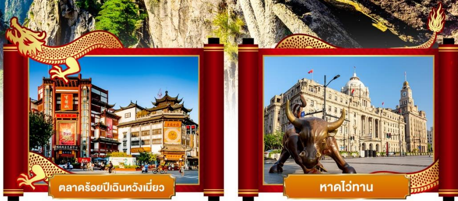
ตลาดร้อยปีฉินหวงเหมียว