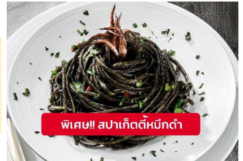
พิเศษ!! สปาเก็ตตี้หมึกดำ

Highlight ! เมื่อเยือนเกาะเวนิส เมนูที่ขึ้นชื่อและหากได้มาต้องได้ลิ้มลอง สปาเก็ตตี้ผัดซอสหมึกดำที่คลุกเคล้ากับความหอมนุ่มนวลกับบรรยากาศสุดคลาสสิคฉบับอิตาเลียนต้นตำรับเวนิส