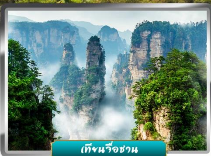
เทียนจื่อซาน

✔ ขึ้นกระเช้ายาวที่สุดในโลก สู่ ประตูสวรรค์