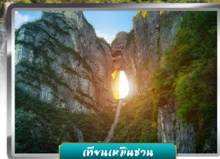
เทียนเหมินชาน