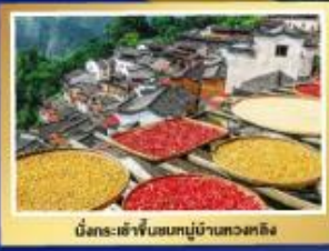
เมืองเซ้าเฟินชนบทบ้านทวดหวัง