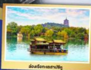
เมืองริชองทะเลสาบซีหู