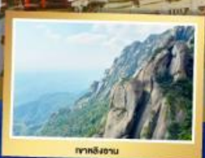
จากหลิงฮาน