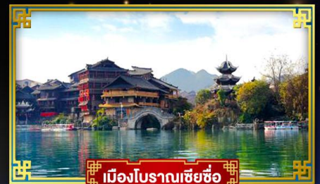
เมืองโบราณเซี่ยซือ