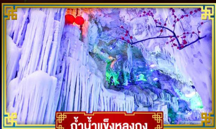
กำนันเจียงหลงกง