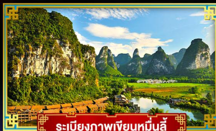
ระเบียงภาพเขียนหมื่นลี้