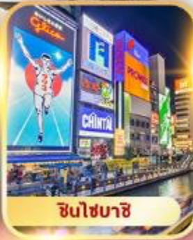
ชินโซบาสึ