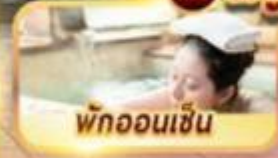
พักออนเซ็น