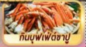
กินบุฟเฟ่ต์ซาซิมิ