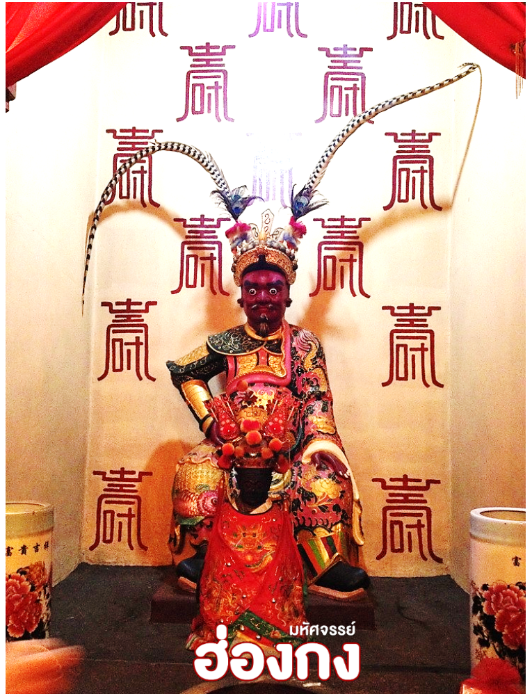
บห้คองส์ย๋ อ้อ๊งกง

นำทุกท่านสู่ วัดแชกง ไชกง มีอายุมากกว่า 400 ปี ตั้งอยู่ในหมู่บ้านโฮซุง เขตไชกง วัดนี้เป็นวัดที่มีฮวงจุ้ยรับพลังที่ดี ภายในวัดเจียบสงบหันหน้าออกสู่ทะเล และมีภูเขาสูงใหญ่อยู่ด้านหลัง มีสถาปัตยกรรมแบบจีนโบราณ โดยมีลักษณะเป็นอาคารไม้เก่าแก่ มีการตกแต่งด้วยศิลปะจีนดั้งเดิม และมีรูปปั้นของนายพลแชกงประดิษฐานอยู่ภายในวัด วัดแห่งนี้ เป็นต้นกำเนิดของค้แชกงในฮ่องกง เนื่องจาก องค์แชกงได้ประดิษฐานที่ วัดนี้ เป็นที่แรก โดยเมื่อประมาณ 100 ปีก่อน ก่อนที่จะมีวัดแชกงหมิวในปัจจุบัน สถานที่ตรงนั้นได้เกิดโรคระบาด จึงได้นำมวลสารและอัญเชิญบารมีของวัดแชกงที่เก่าแห่งนี้ไปสร้างวัดแชกงหมิวเพื่อเป็นขวัญและกำลังใจ และขับไล่ปัดเป่าสิ่งชั่วร้าย จนกลายเป็นหนึ่งองค์แชกงที่เป็นที่รู้จักของนักธุรกิจในหลายประเทศ วัดแห่งนี้แห่งนี้จะมี กั๊งหัน เก่าแก่อายุกว่า 400 ปี กั๊งหัน ด้านซ้ายที่จะขอพรเรื่องครอบครัว และด้านขวาจะขอพรเรื่องหน้าที่การงานและประสบความสำเร็จในชีวิต