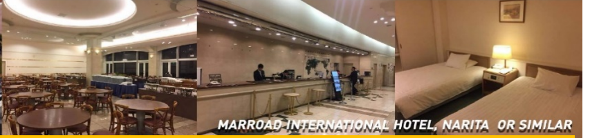
MARROAD INTERNATIONAL HOTEL, NARITA OR SIMILAR