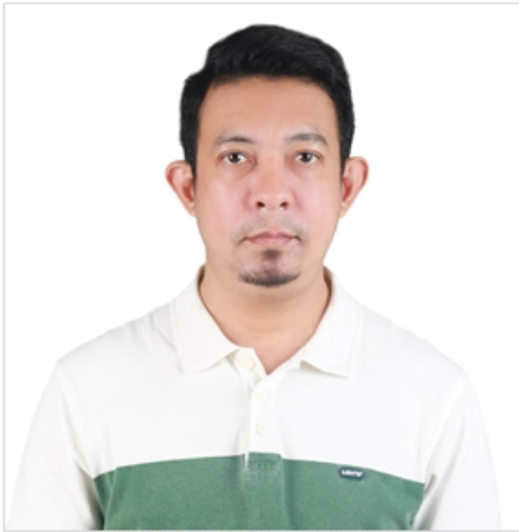
(ตัวอย่างรูปถ่าย)