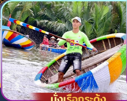
นั่งเรือกระด้าง