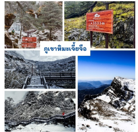
ในฤดูใบไม้ผลิและฤดูร้อน ระหว่างเดือนพฤษภาคม-กันยายน ดอกไม้นานาพรรณพร้อมที่จะบานสะพรั่งมากกว่า 30 ชนิด โดยเฉพาะกุหลาบพันปีนับหมื่นต้นทยอยบานตั้งแต่เชิงเขาถึงยอดเขา และในช่วงแต่ถ้าจะดูสีสันที่สวยงามที่สุดก็ต้องช่วงฤดูใบไม้เปลี่ยนสี ประมาณเดือนตุลาคม – เดือนพฤศจิกายน

นำท่านเดินทางสู่ ภูเขาหิมะเจ็ยจื่อ (รวมรถแคบเตอร์+กระเช้า) ใช้เวลาเดินทางประมาณ 2 ชั่วโมง ภูเขาหิมะแห่งเมืองคุณหมิง สถานที่ท่องเที่ยวแห่งใหม่ของมณฑลยูนนาน ตั้งอยู่ทางภาคเหนือของเมืองคุณหมิง ระยะทาง 250 กิโลเมตร นำท่านนั่งกระเช้าขึ้นสู่ด้านบนของภูเขา ที่ระดับความสูง 4,223 เมตร เหนือระดับน้ำทะเล จากนั้นนำท่านนั่งกระเช้าจุดที่ 1 และเปลี่ยนเป็นรถรถอุทยานใช้เวลาประมาณ 20 นาทีเพื่อขึ้นไปยังจุดกระเช้าที่ 2 ให้ท่านได้ชื่นชมทิวทัศน์อันสวยงามของภูเขาหิมะเจ็ยจื่อ (Jiaozi Mountain) ภูเขาหิมะแห่งเมืองคุณหมิง ฤดูหนาวระหว่างเดือนพฤศจิกายน - มีนาคมมีหิมะปกคลุมทั้งภูเขา ระหว่างทางท่านจะได้พบ สิ่งมหัศจรรย์มากมาย อาทิเช่น หิมะที่เกาะบนต้นไม้ และน้ำตกบนหน้าผาที่จับตัวเป็นน้ำแข็ง ล้ำธาร รูปทรงต่าง ๆ เป็นต้น ในฤดูใบไม้ผลิและฤดูร้อน ระหว่างเดือนพฤษภาคม-กันยายน ดอกไม้นานาพรรณพร้อมที่จะบานสะพรั่งมากกว่า 30 ชนิด โดยเฉพาะกุหลาบพันปีนับหมื่นต้นทยอยบานตั้งแต่เชิงเขาถึงยอดเขา และในช่วงแต่ถ้าจะดูสีสันที่สวยงามที่สุดก็ต้องช่วงฤดูใบไม้เปลี่ยนสี ประมาณเดือนตุลาคม – เดือนพฤศจิกายน