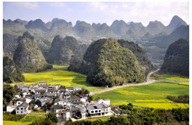
พักที่ TAO YUAN HOTEL หรือเทียบเท่า 4 ดาวจีน

วันที่สาม อุทยานภูเขาเหนียงเหนียงซาน(รวมกระเช้า)-ถ้ำเจ้าแม่กวนอิม –แกรนด์แคนยอนแม่น้ำลี่วเซอเหอ-ล่องเรือถ้ำเจียงหยวน-ซื้อปั้งเมืองเก่าสุ่ยเจิน