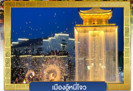
เมืองอู่หนี่โจว