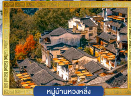
หมู่บ้านหวงหลิ่ง