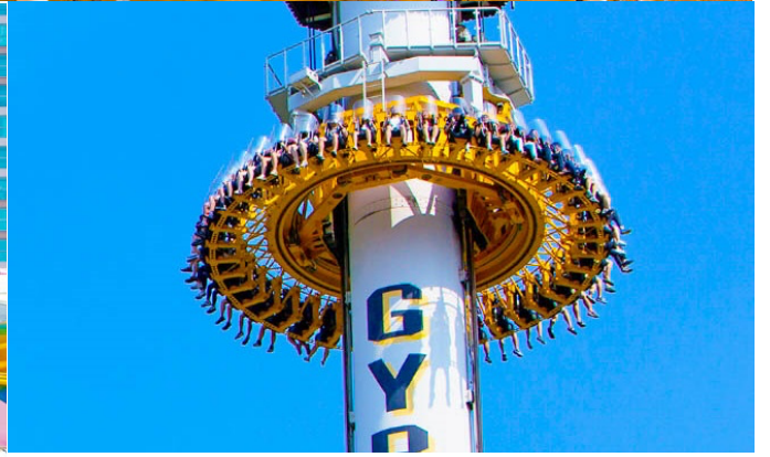
เที่ยง อีศระอาหารกลางวัน ณ สวนสนุกล็อตเต้เวิลด์ (เพื่อให้ท่านได้สนุกอย่างเต็มที่)