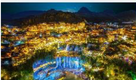
ฝูหลงเจิน