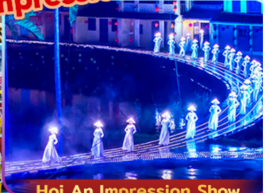
Hoi An Impression Show