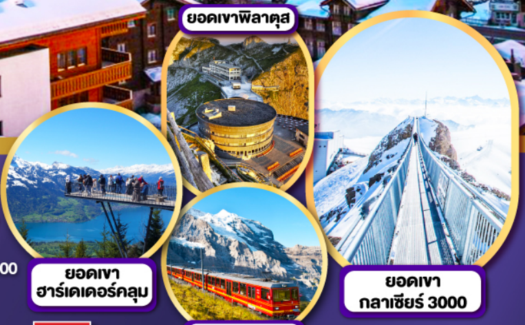
ยอดเขา ฮาร์เดอร์คูลม