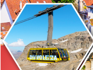
กระเช้าดีอ่าวเลซซา