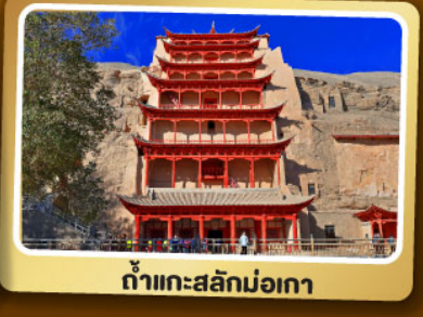
กำแพงสลักม่อเกา