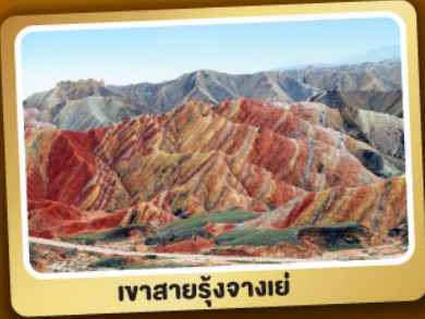
เวาสายรุ้งจางเย่