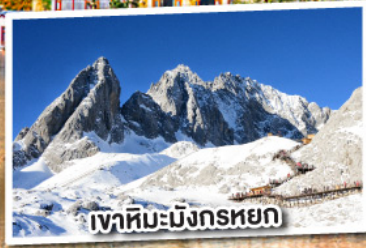
เขาคิมะมิงกรหยก