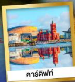
คาร์ดิฟฟ์