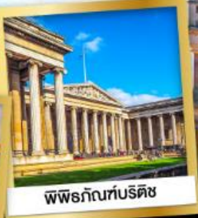
พิพิธภัณฑ์บริติช