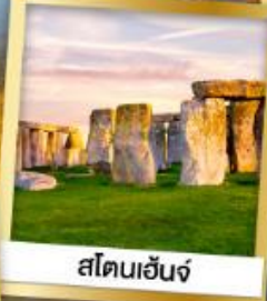
สโตนเฮนจ์