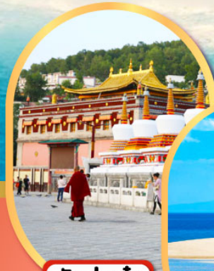
วัดต้าอ๋อ