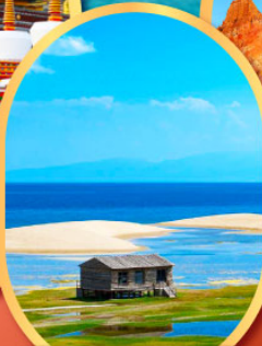
ทะเลสาบชิงไห่