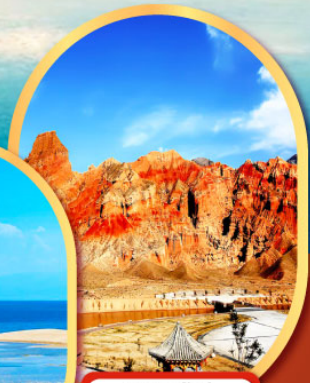
หุบเขาห้าสี อุทยานธรณีกุ้ยเต๋อ