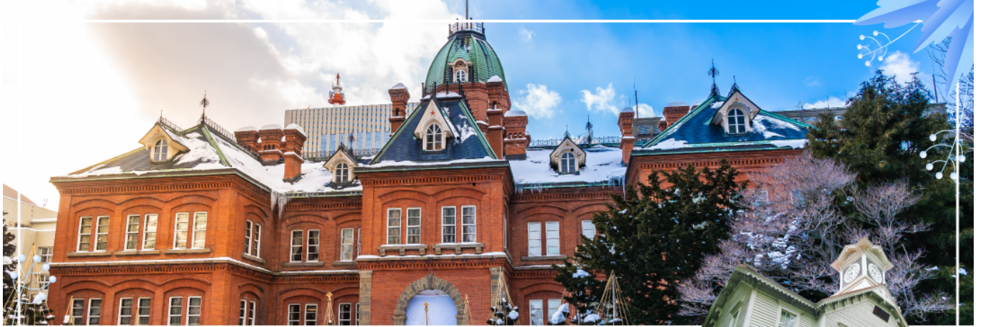
FORMER GOVERNMENT OFFICE BUILDING ที่ทำการรัฐบาลเก่าฮอกไกโด

นับเป็นอาคารขนาดใหญ่แห่งหนึ่งในไม่กี่อาคารของญี่ปุ่นในสมัยนั้น ภายในตกแต่งอย่างหรูหรา ด้านหน้ามีสัญลักษณ์ดาวห้าแฉก ธงรูปดาวเจ็ดแฉก และสวนหย่อมที่ร่มรื่น เรียงรายด้วยต้นซากุระ และต้นแปะก๊วย อาคารแห่งนี้เคยเป็นที่ทำการรัฐบาลท้องถิ่นสมัยบุกเบิกเกาะฮอกไกโด ปัจจุบันเปิดให้ประชาชนเข้าชมห้องทำงานต่างๆ และหอสมุดเก็บบันทึกทางราชการ ผ่านชม หอนาฬิกาเมืองซัปโปโร (Sapporo Clock Tower หรือภาษาญี่ปุ่นเรียกว่า Sapporo