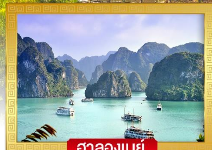
ฮาลองเบย์