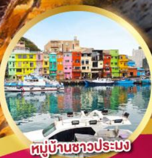
หมู่บ้านชาวประมง