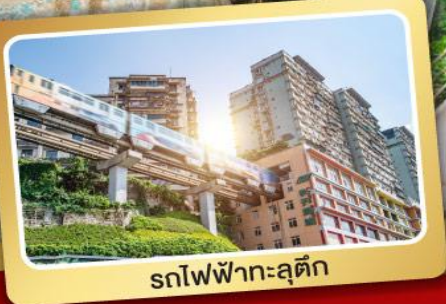
รถไฟฟ้าทะลุตึก