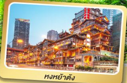
หงหย่าต้ง