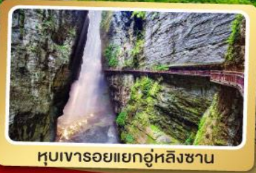
หุบเขารอยแยกอู่หลิงซาน