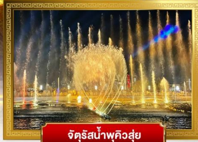
จัตุรัสน้ำพุควิ๋วสู่ย