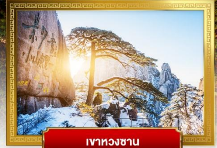
ภูเขาหวงซาน